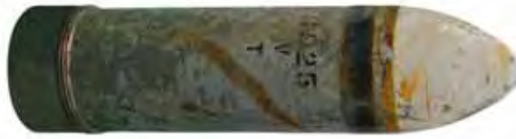
12-cm-Granate aus dem Vierwaldstättersee. Die Korrosionsspuren stammen vom Hebevorgang.

tration an Munition (Hotspots). Die rote Linie stellt ein Seekabel dar.