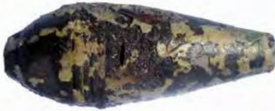
Granate aus dem Thunersee mit Korrosionserscheinungen, die auf das Explosionsunglück Mitholz zurückzuführen sind.