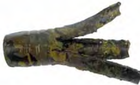
Versenkte Geschossüberreste vom Explosionsunglück Mitholz.

versenkte Munition zurückzuführen wären. An rund 20 Standorten wurden bis zu einem Meter lange Bohrkern aus dem Sediment entnommen und auf Sprengstoffe und Schwermetalle untersucht. In keinem davon wurden Sprengstoffe oder Abbauprodukte davon nachgewiesen. Die Schwermetallgehalte liegen im Bereich der natürlichen Belastung. Einzig in Sedimenten des Thunersees wurden in einer klar definierten Bodenschicht Spuren von Diphenylamin (DPA) festgestellt, ein Stoff, der als Stabilisator von Treibladungen eingesetzt wird. Alles deutet darauf hin, dass dieser Stoff aus der ehemaligen Eidg. Pulverfabrik Wimmis in den Thunersee gelangt ist.